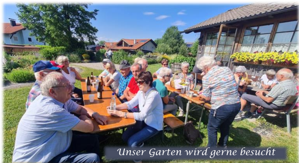
Unser Garten wird gerne besucht